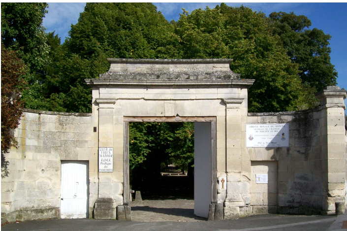
Portail de l'abbaye du Moncel

Une fabrique de jardin est une construction à vocation ornementale prenant part à une composition paysagère au sein d'un parc ou d'un jardin. Prenant les formes les plus diverses, voire extravagantes, elles évoquent en général des éléments architecturaux inspirés de l'antiquité, de l'histoire ou de la nature. Plusieurs fabriques ornent le parc du château d'Ognon, dont notamment des statues des Vertus, du début du XVII e siècle