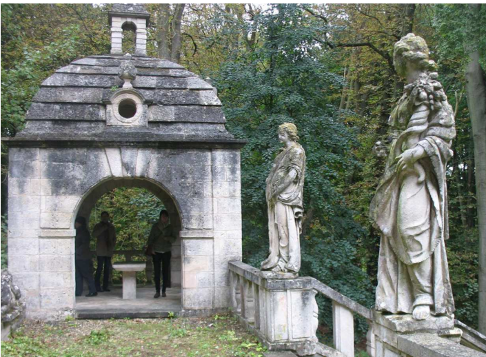
Parc du Château d'Ognon : gloriette et fabriques

Une fabrique de jardin est une construction à vocation ornementale prenant part à une composition paysagère au sein d'un parc ou d'un jardin. Prenant les formes les plus diverses, voire extravagantes, elles évoquent en général des éléments architecturaux inspirés de l'antiquité, de l'histoire ou de la nature. Plusieurs fabriques ornent le parc du château d'Ognon, dont notamment des statues des Vertus, du début du XVII e siècle