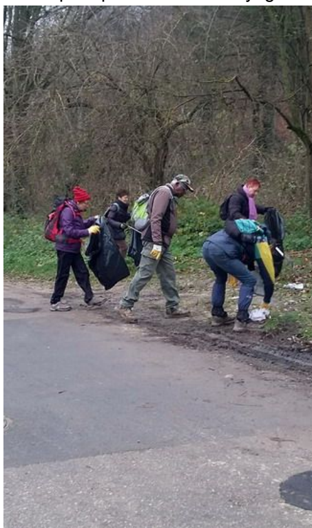
Nettoyage du parcours