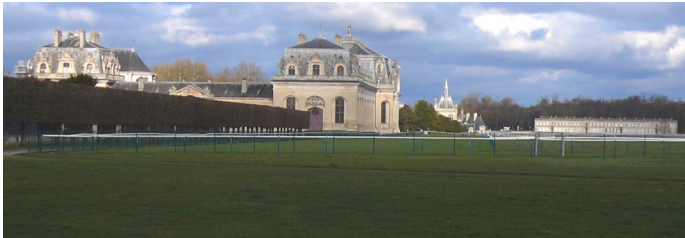
Chantilly, son château son musée du cheval et son hippodrome.