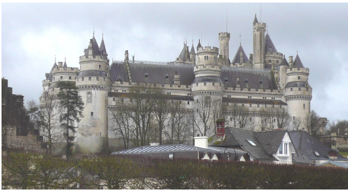
Construit à la fin du XIV e siècle par le duc Louis d'Orléans, le château de Pierrefonds est démantelé au XVII e et se trouve à l'état de ruines lorsque Napoléon III décide d'en confier la reconstruction à l'architecte Eugène Viollet-le-Duc qui met en pratique ses conceptions architecturales pour en faire un château idéal tel qu'il aurait existé au Moyen Age.