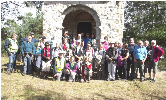
Edition 2017 en forêt d'Ermenonville

Le dimanche, la randonnée se fera intégralement sur Chantilly et ses environs. Nous partirons du parking des Bourgognes pour remonter sur Vineuil-Saint-Firmin en passant par le bois de la Basse Pommeraye pour redescendre sur Courteuil, et déjeuner à Avilly Saint Léonard. Nous repartirons sur Chantilly pour une visite du parc du château, longer l'hippodrome et rejoindre le centre ville afin de visiter la pharmacie du duc de Condé. Nous retournerons enfin au parking des Bourgognes pour y boire le pot de l'amitié.