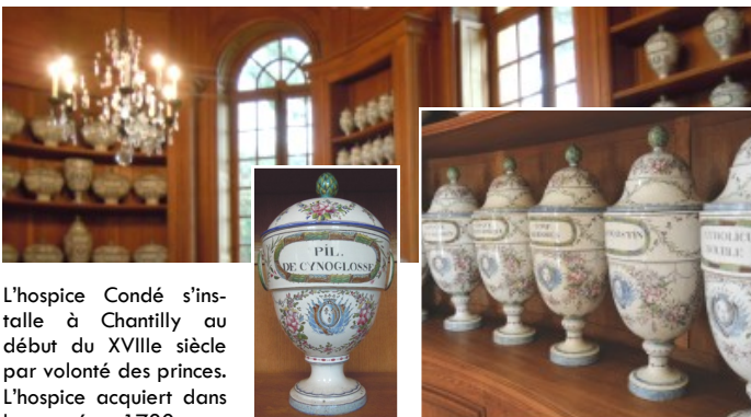
L'hospice Condé s'installe à Chantilly au début du XVIII e siècle par volonté des princes. L'hospice acquiert dans les années 1780, une collection de pots à pharmacie en faïence polychrome afin de conserver les poudres, onguents, pilules et autres substances utilisées comme médicaments. Cette collection, miraculeusement conservée est installée dans la chapelle de l'hospice.

A 50 kilomètres au nord de Paris, les forêts qui entourent la Vallée de l'Oise sont parmi les plus belles de France : Chantilly, Ermenonville, Hez, Halatte, Compiègne, Laigüe